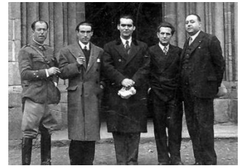
Lorca en Betanzos 1932

La exposición celebra el 90 aniversario de la primera edición de Seis poemas galegos (1935), una obra excepcional dentro de la producción de Lorca y un hito de la literatura gallega del siglo XX, al estar escrita en lengua gallega por el autor andaluz.